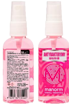
Manorm Coral Kod kreskowy: 4820136730222