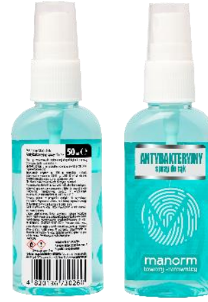
Manorm Malachite Kod kreskowy: 4820136730260