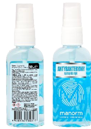
Manorm Aquamarine Kod kreskowy: 4820136730307