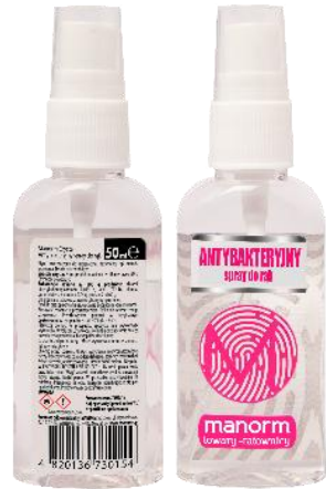
Manorm Crystal Kod kreskowy: 4820136730154